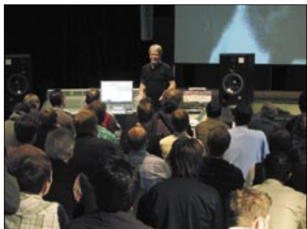
Vollbesetzte Ränge beim Workshop des Meisters George Massenburg. In der Workshophalle wurden ein 5.1 ATC-Surroundsystem, Pro Tools mit D-Control und einige analoge Leckerbissen aufgebaut

eigenschaften leistet, tut dies meist zur Erfüllung des eigenen Anspruchs und ohne Rücksicht darauf, auf welchem Mobiltelefon die Produktion später einmal landet. Die