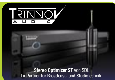
Stereo Optimizer ST von SDI. Ihr Partner für Broadcast- und Studioteknik.

Der neue Optimizer ST für alle Stereo Applikationen zum fairen Einstiegspreis von 2950,- € netto .