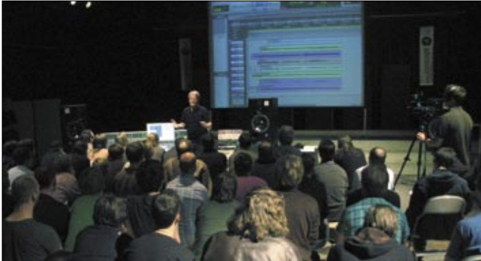
Massenburg-Workshop Teil 2: Hier werden historische Produktionen analysiert und zu Gehör gebracht

unfertigen Zustand, wurde mit Akustikmodulen für die Hi-End Gear ‚veredelt‘, um eine halbwegs verlässliche Abhörsituation herzustellen. Während der spätere Aufnahmerraum kurzfristig unter der Regie von Stefan Heger (MasteringWorks) zu einem Mastering-Studio umfunktioniert und zur Spielweise für die Besucher wurde, moderierte Guido Apke die Ereignisse und Workshops im später einmal als Regie verwendeten Abhörraum und sorgte für eine ununterbrochene Vorführung der von verschiedenen Ausstellern hereingetragenen Geräte. Studioteknik zum Anfassen und vergleichenden Hören, ganz wie man es sich als Besucher von einer solchen Veranstaltung wünscht. Zum Ausklang des zweiten Veranstaltungstages referierte Friedemann Tischmeyer, Gründer der ‚Pleasurize Music Foundation‘, Mastering-Ingenieur und Buchautor, zu Arbeitsstrategien im Mastering-Alltag angesichts des heute bis zum Exzess getriebenen Lautheitswahns. Den Abschluss bildete eine Roundtable-Diskussion, moderiert von Multitalent Hannes