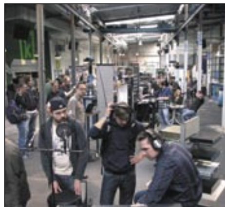
Blick in die Ausstellungshalle, die am ersten Tag doch recht gut besucht war

Nicht erst das ‚Desaster von München‘ einer am Rande der Existenz balancierenden AES Convention macht uns deutlich, dass