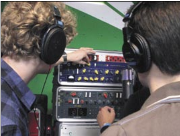
„Wenn ich so weit aufdrehe, geht rechts die rote Lampe an“... An beiden Tagen wurde mit wachsender Begeisterung geschraubt, was das Zeug hielt