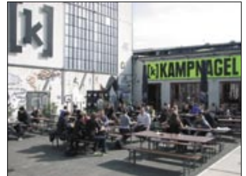
Biergarten-Stimmung bei strahlendem Sonnenschein: Das Kampnagel-Außengelände